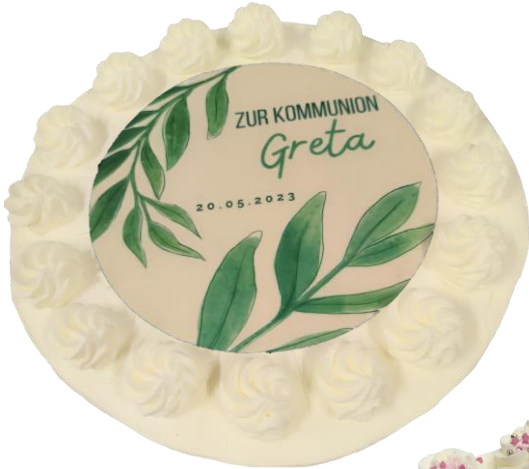
1) Klassische Tupfen