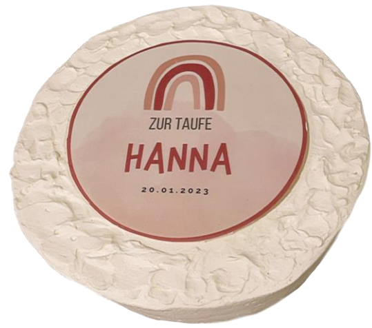
3) Wellige Oberfläche